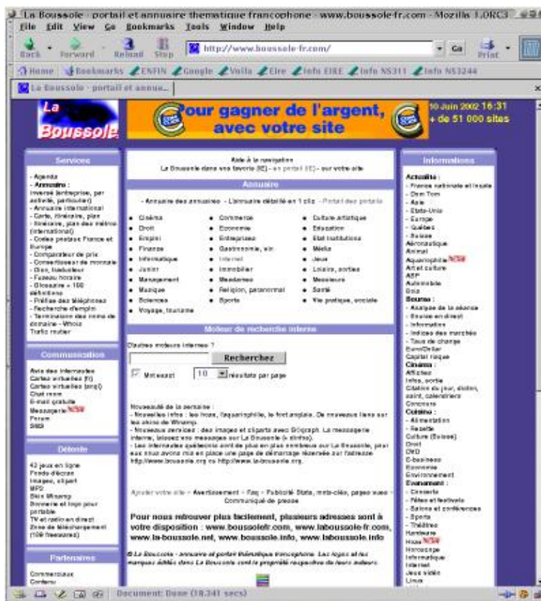
Copie écran de la page de garde du site la Boussole

« Moteurzine ». — Pensez-vous que les outils de recherche de proximité (généralistes, mais aussi et surtout régionaux et thématiques) ont vraiment leur place sur le paysage internet francophone ?